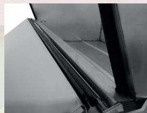
Abbildung Frontklappe mit Dichtungen