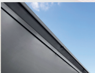
Abbildung zeigt die Verstärkung der Schüttung