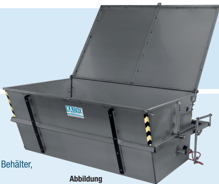
Abbildung 1120 ltr. ohne Frontklappe