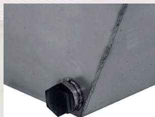
Abbildung Ablass mit 1 Zoll Größe